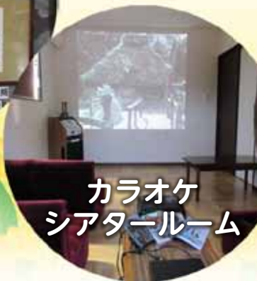
カラオケ シアタールーム